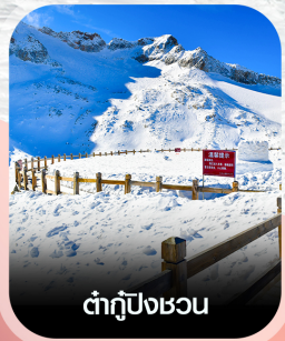
ต้ากู่ปิงชอน