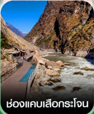
ช่องแคบเสื่อกระโจน