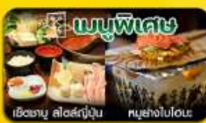
เช็ต ซาซึมิ สไตล์ญี่ปุ่น , เซ็ตหมูย่างใบโหระพา

SCAN ME ฮาคุบะ-นั่งกระเช้าชมวิว-กาแฟ City Breakery-ชิราคาวะโกะ-ทาคายาม่า-วัดน้ำใส-ช้อปปิ้งชินไซบาชิ-อิสระช้อปปิ้งเต็มวัน