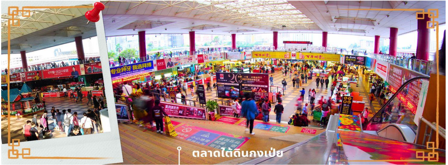
ตลาดใต้ดินกงเป่ย

นำท่านเข้าสู่ที่พัก IRVINE HOLIDAY HOTEL หรือเทียบเท่า