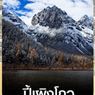
ปีเผิงโกว