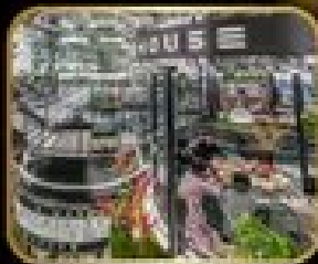
ภัตตาคาร เริ่มต้น WAREHOUSE NO.3