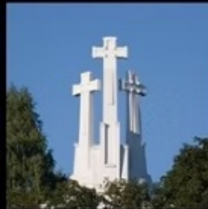
Three Crosses Monument