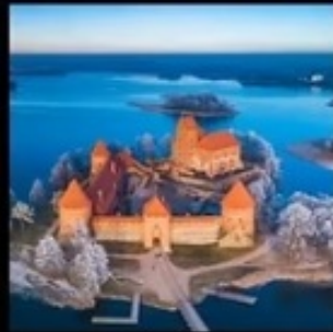
ปราสาทกราก