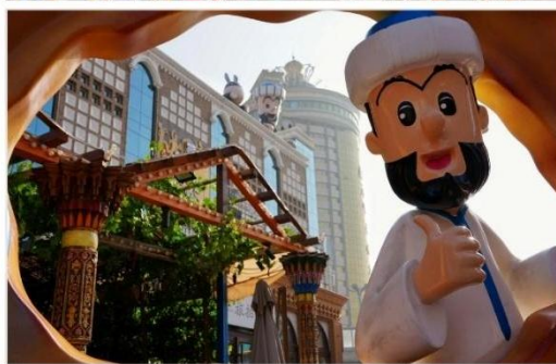
ตลาดนานาชาติซินเจียงแกรนด์บาร์ซาร์