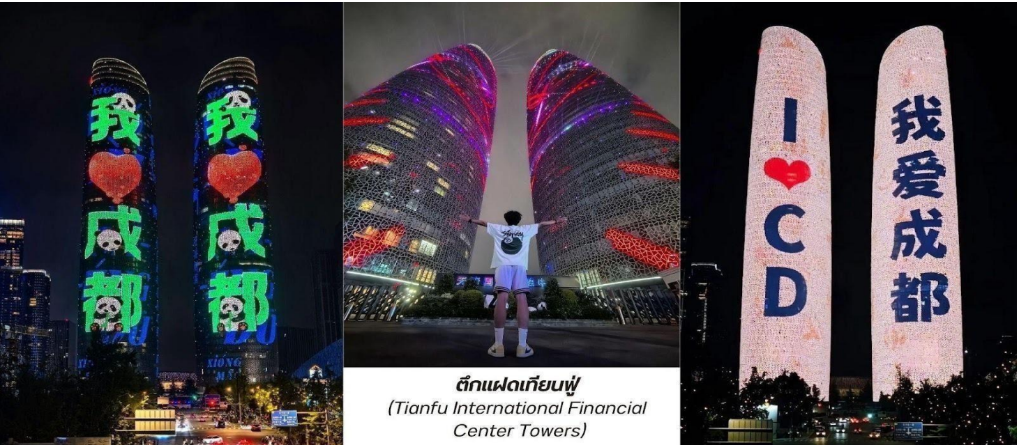
ตึกแฝดเทียนฟู (Tianfu International Financial Center Towers)

สมควรแก่เวลา นำท่านเดินทางกลับสู่โรงแรมที่พัก ระหว่างทางนำท่านแวะชมแสงสีถ่ายรูปลักษณ์ด้านนอก ตึกแฝดเทียนฟู (Tianfu International Financial Center Towers, 天府双塔) สัญลักษณ์แห่งความทันสมัยและความก้าวหน้าของเมืองเจิ้งตู ตึกระฟ้าแฝดแห่งนี้ตั้งตระหง่านอยู่ใจกลางย่านการเงินแห่งใหม่ ตึกแฝดเทียนฟูมีความสูงกว่า 220 เมตร แต่ละตึกมีดีไซน์ที่โฉบเฉี่ยวและเป็นเอกลักษณ์ โดยเฉพาะในยามค่ำคืน ตัวอาคารจะถูกประดับ ประดาด้วยไฟ LED ที่สว่างไสว ทำให้เกิดการแสดงแสงสีที่สวยงามตระการตา