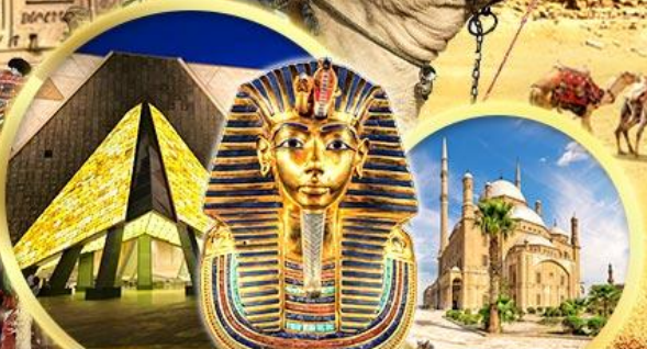
พิพิธภัณฑ์แกรนด์อียิปต์ บิอมปรการชาลาติน

เข้าชม 2 พิพิธภัณฑ์ GRAND EGYPTIAN MUSEUM & NMEC พิพิธภัณฑ์โบราณคดีใหม่และพิพิธภัณฑ์จัดแสดงมัมมี่