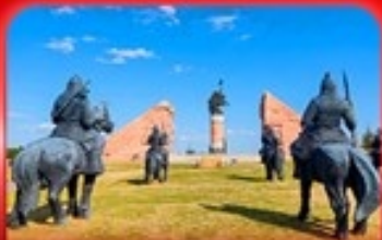
สวนสาธารณะเจงกิสข่าน