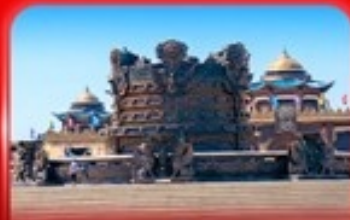
ศูนย์วัฒนธรรม มองโกเลีย หยวนหลิว