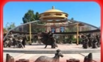
สวนวัฒนธรรมการแต่งจานจอร์จอส