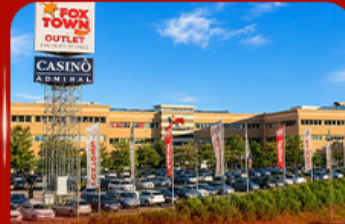
ฟ็อกซ์ทาวน์ เมาท์เคิลิก