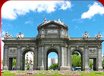
เช็ควินประตูอัลกาลา มาดริด