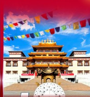
วัดพระโพธิสัตว์ อูลาน