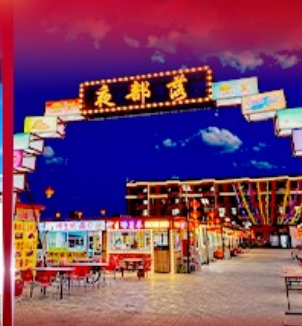
ตลาดกลางคืน ตาลาเดอด้