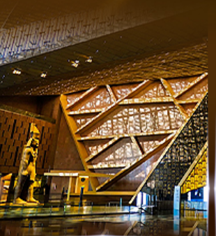
พิพิธภัณฑ์แกรนด์อียิปต์ (GEM)