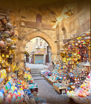
ตลาดห่านเอลคาลี