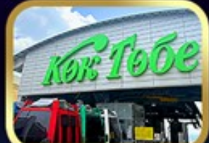
ซินโทกโทเบมวิอัลมาตี

นั่งกระเช้าชิมบุลัค • ทะเลสาบโคลโซ • ชารินเกรนด์แคนอน