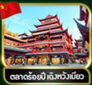
ตลาดร้อยปี เจิวหวงเหมียว