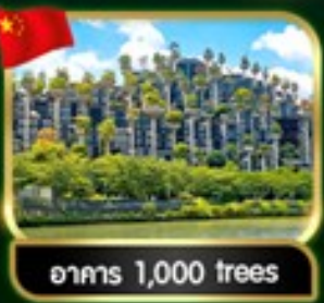
อาคาร 1,000 trees