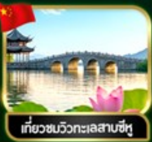
เที่ยวชมวิวทะเลสาบซีหู