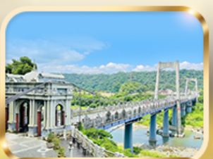
สะพานต้าซี เกาหยวน