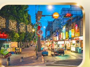
หนิงเซี่ย ไนท์มาร์เก็ต