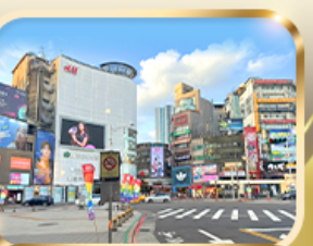
ช้อปปิ้งย่านซีเหมินติง