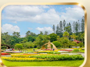
สวนบ้านปรน.เจียงไคเช็ก