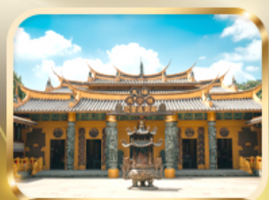
วัดต้าซี ขอความรวย