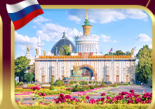
สวนสาธารณะ VDNKH