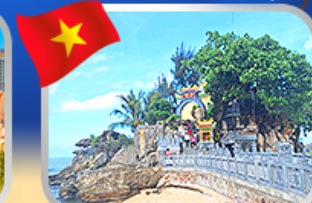
ลึกลับระฆังพลาซ่าเจ้าดิงเกา