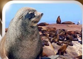
ล่องเรือชมฝูงแมวน้ำ Seal Island

ทะเลทรายซาฟารี อุทยานสัตว์ป่าหุบเขาพิลานเนเบิร์ก