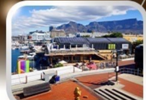
ช้อปปิ้งท่าเรือแบรนด์ชั้นนำ V&A waterfront