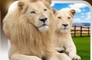
เข้าชมสวนเสือแบงโกลิซิด The Lion Park