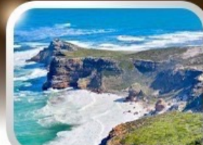
ชมวิวยุคปลายสุดแอฟริกา cape of good hope