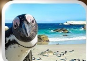
Simon's Town ชมนกเพนกวินสุดน่ารัก