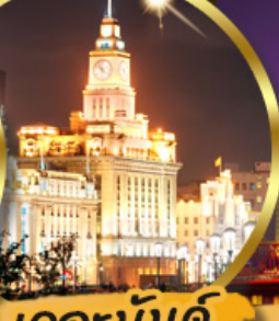
เดอะแลนด์