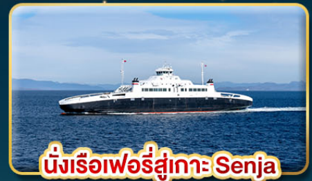
นั่งเรือเฟอร์รี่สู่เกาะ Senja