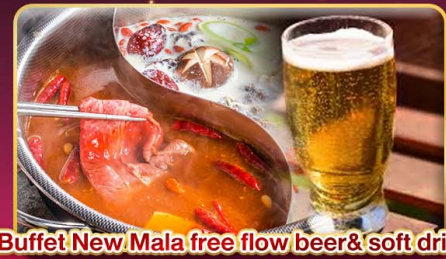
*Buffet New Mala free flow beer & soft drink