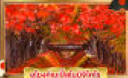
วัดมิกะโงจิ Miyako-ji Temple