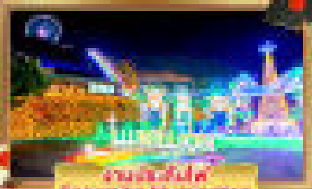
สวนสาธารณะ Sagami Park