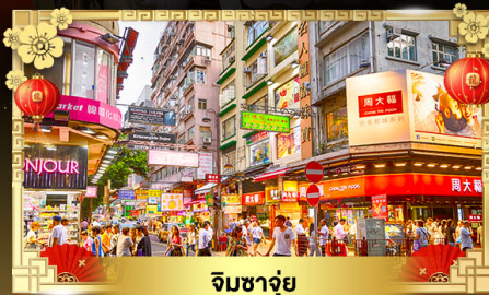
จิมซาจุ่ย