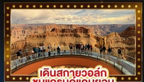
เดินสกายวอล์ก ชมแกรนด์แคนยอน