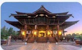
วัดเซ็นโคจิ นากาโนะ