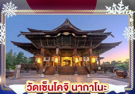
วัดเซ็นโคจิ นากาโนะ