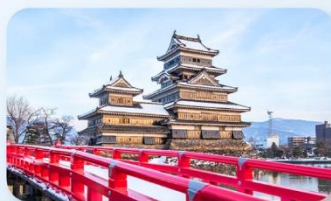
ปราสาทมิตสึโมโด้