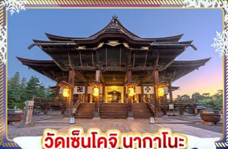
วัดเซ็นโคจิ นากาโนะ