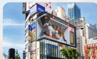
ซ้อปปิงชินจูกุ