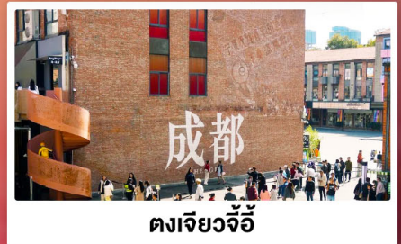
ตงเจียงจี้