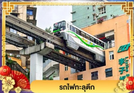
รถไฟฟ้า-ลูตึก