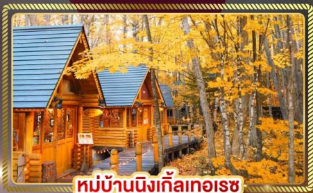
หมู่บ้านนิงเกิ้ลทอเรซ