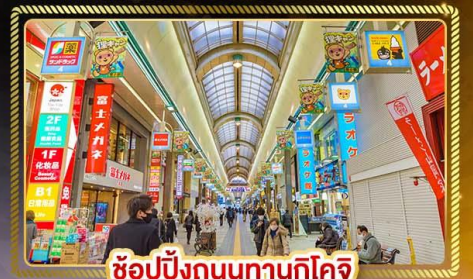
ช้อปปิ้งถนนทานุกุโคจิ