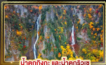
น้ำตกทิงกะ และน้ำตกริวเซ