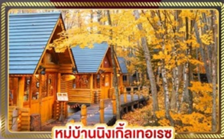
หมู่บ้านนิงเกิ้ลทอเรซ