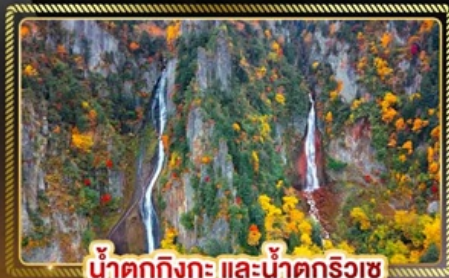
น้ำตกทิงกะ และน้ำตกริวซ