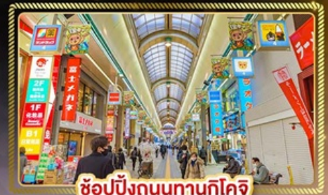
ช้อปปิ้งถนนทานุกิโคจิ