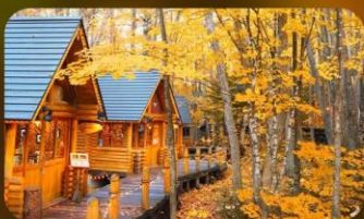
หมู่บ้านนิงเกิ้ลทอเรซ

SAPPORO TOKYU REI หรือเทียบเท่ามาตรฐานญี่ปุ่น