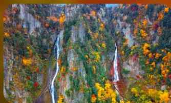
น้ำตกกิงกะ และน้ำตกริวเซ