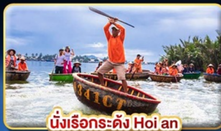
นั่งเรือกระด้ง Hoi an