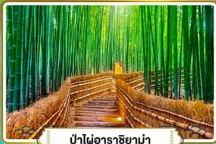
ป่าไฟอาราชิยาม่า