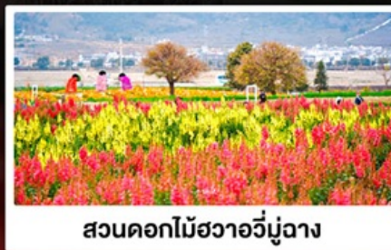
สวนดอกไม้สีสวยอวิมู่ฉาง