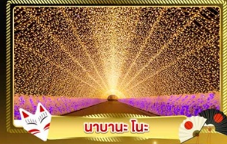
นาบานะ โนะ