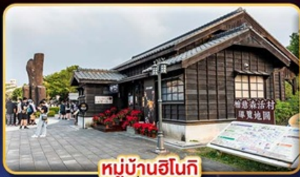
หมู่บ้านอินทิกิ

"ไทเป" มหานครแห่งเมืองสี่พัน เที่ยวจุใจ เช็กอินจุดไฮไลท์