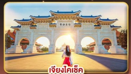
เจียงไคซีค