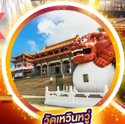
วัดหัวหน่วง