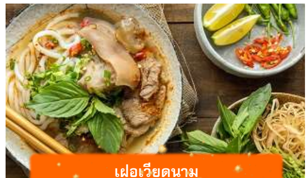
เฟอเวียดนาม