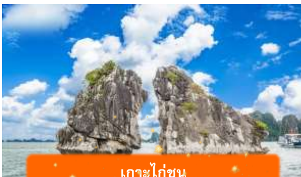
เกาะไก่ชน

เที่ยง บริการอาหารกลางวัน ณ ภัตตาคาร พิเศษ ... เมนูซีฟู้ดบนเรือ