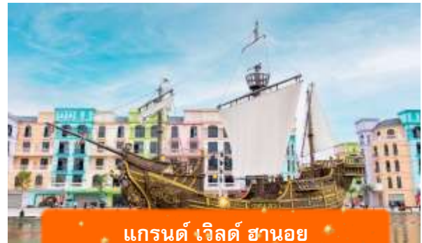
แกรนด์ เวิลด์ ฮานอย

ที่พัก SONG LOC LUXURY HOTEL ระดับ 4 ดาวมาตรฐานท้องถิ่น หรือเทียบเท่า