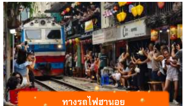
ทางรถไฟฮานอย

17.55 เดินทางถึง สนามบินสุวรรณภูมิ ประเทศไทย โดยสวัสดิภาพ ... พร้อมความประทับใจ