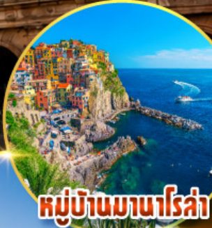
หมู่บ้านมานาโรซ่า