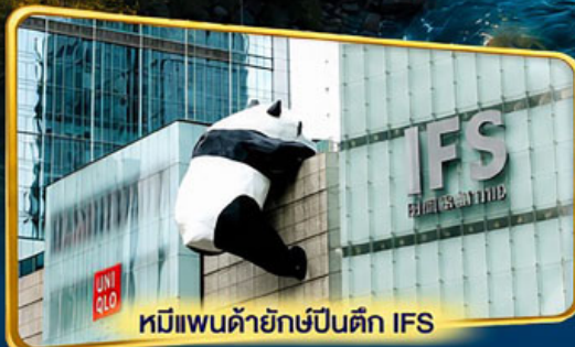
หมีแพนด้ายักษ์ป็นตึก IFS