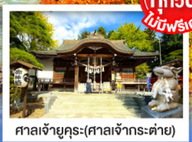
ศาลเจ้ายุคุระ(ศาลเจ้ากระต่าย)

พิเศษบุฟเฟ่ต์ซาบุดะพรีเมียม ปูออกโทโด อาหารทะเล เนื้อวากิว สเต็ก ซูชิโอคุระ และเครื่องดื่มไม่อัน