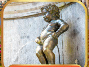
หูน้อยมานเทินพิส