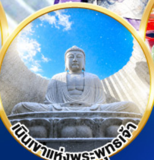
เดินทางแห่งพระพุทธรูป