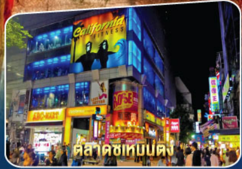
ตลาดซีเหมินตง