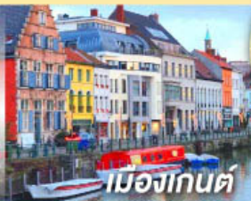
เมืองเกนต์