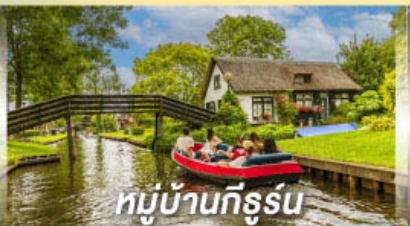
หมู่บ้านทีร์รูน