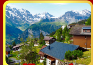
หมู่บ้านมอร์ริส