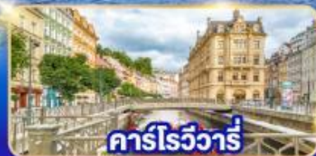
คาร์โรวารี