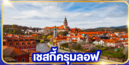
เซกักรุมลอฟ