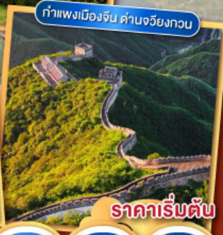
กำแพงเมืองจีน ด้านจวิ๋นกงวน