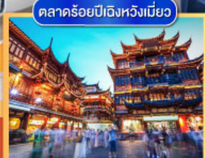
ตลาดร้อยปีเมืองหวงเหมียว