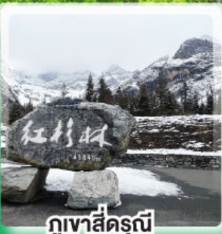
ภูเขาสี่รุณี